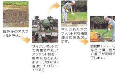
破砕後のアスファルト廃材。

道路補修工事で、破砕したアスファルト材を現場でそのまま加熱処理し、仮舗装用に再利用できるアスファルト再生プラントです。