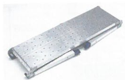
DWJ-96 (収納状態) 折りたたみ式ですので運搬時や収納時にスペースをとりません