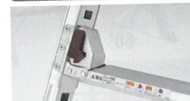
脚の長さは伸縮レバーで、50mmピッチで調整できます