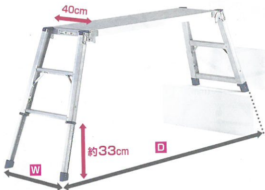
DWJ-96 (段差設置状態) ※掲載写真の段差は撮影のためのものです