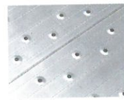
天場踏面 プレス式ノンスリップ加工で滑りにくくなっています