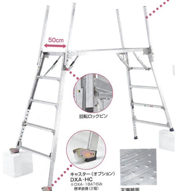
DXA-18AT (段差設置状態) ※掲載写真の段差は撮影のためのものです