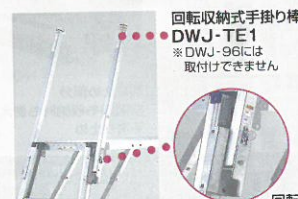
※詳細、その他オプションはP.072