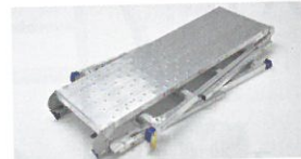
DXA-18AT (収納状態) 折りたたみ式ですので運搬時や収納時にスペースをとりません。