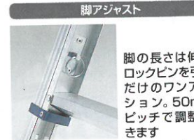
脚の長さは伸縮ロックピンを引くだけのワンアクション。50mmピッチで調整できます