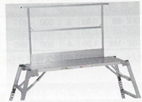
手すりわく (爪先板付き) DWG-TEL ※詳細、その他オプションはP.072