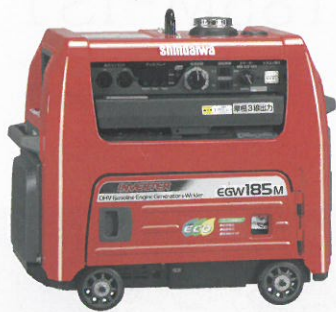
EGW185M-IST ¥759,150(税込)(税抜価格 ¥723,000)