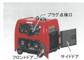
プラグ点検口 フロントドア サイドドア