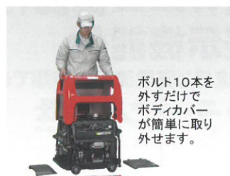
ボルト10本を外すだけでボディカバーが簡単に取り外せます。

●量産仕様と異なることがあります。また、よりよい製品を造るため仕様を予告なく変更することがあります。●記載の価格は全て希望小売価格です。消費税率は5%の場合です。なお、配送費、付帯工事費、使用済み商品の引き取り費は含まれておりません。