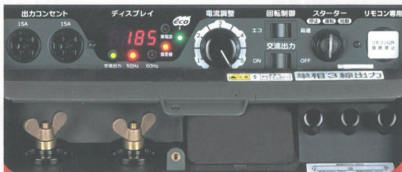
※発電出力は合計で5.0kVA (単相3線出力端子:1組、単相100Vコンセント:15A×2個)