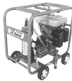
730GK・1021GK 1515GK ①②⑥⑧⑨⑩⑭